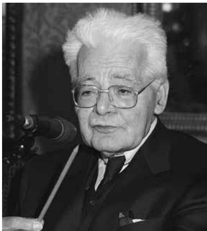
Luigi Di Bella

Il caso Di Bella ha portato alla ribalta, qualora ce ne fosse stato bisogno, l'importanza della diffusione dell'informazione in campo sanitario. Non vogliamo entrare nel merito del caso del medico modenese, ma quello che c'è da notare è il fatto che Luigi Di Bella per oltre 20 anni ha cercato, a torto o a ragione, di portare avanti un suo discorso sui problemi legati al cancro, senza essere minimamente ascoltato. Eppure, non appena qualche medium ha iniziato a parlarne, vi è stata un'esplosione di notizie che ha visto, fra l'altro, Internet come protagonista. I documenti presenti in rete dove si menziona il nome Di Bella, basta digitarlo in uno dei motori di ricerca, sono aumentati in pochi giorni in maniera impressionante raggiungendo i 113 che moltiplicati (per difetto) per una media di 10 pagine per documento fanno 1130 pagine.