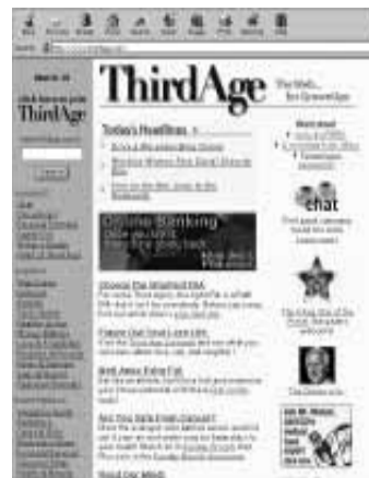
La terza età come specializzazione

Ed allora diciamolo chiaramente: non far usare le nuove tecnologie a persone considerate "anziane" è una sorta di