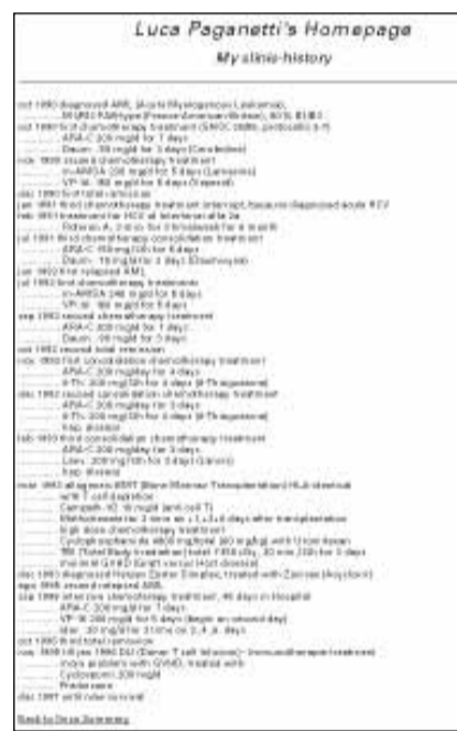
Otto anni di calvario

Se da una parte il tentativo di rappresentare i propri problemi attraverso Internet è condivisibile, apprezzabile e soprattutto da incoraggiare,