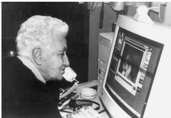
Dalla casa per anziani di Faido in videoconferenza con la famiglia

Nel 1982, l'Assemblea mondiale convocata dall'Onu a Vienna, ha adottato un "Piano d'azione mondiale sull'invecchiamento" attirando l'attenzione sui problemi della persona anziana, esplicitando e ricono-